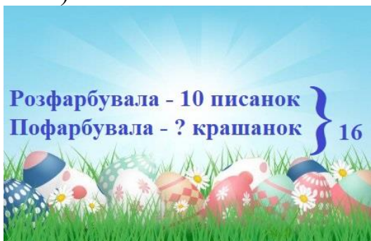
СХЕМА ЗАПИСУ ЗАДАЧІ (Зразок)

Склади ще одну задачу за цим сюжетом (малюнок з короткою схемою нижче. Усно).